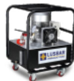
Двухскоростной насос LPE

Сокращение времени цикла и повышение производительности.